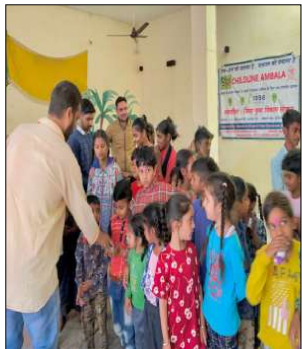
On Dated 03 rd February, 2023 CHIDLIN Ambala organized a special program at Bharat Vikas Parishad, Ghel Road, Ambala where CHIDLIN Ambala Coordinator and Team member aware those children about " CHILD HELPLINE 1098 and Cyber Security ". In which team member aware those students about "CHILD HELPLINE 1098".