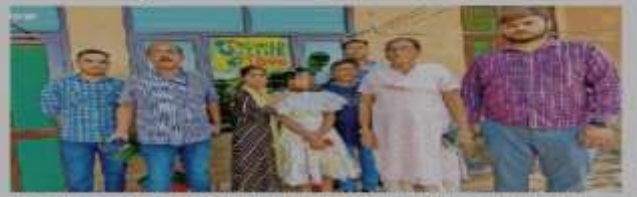
बच्ची को कोलकाता पुलिस की मौजूदगी में स्वजनों के समुदाय करते चारुलाल टीम सदस्य।