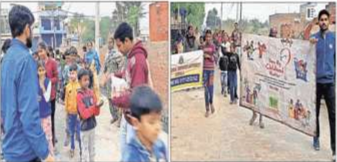
केंद्र के एकता विहार में बच्चों के साथ जागरूकता रैली निकालते चाइल्डलाइन के सदस्य।

अंबाला शहर की 13 नवम्बर (कोच) : जिला विधिक सेवा प्राधिकरण व जिला युवा विकास संगठन द्वारा संचालित चाइल्डलाइन के संयुक्त तत्वाधान में 'एकता विहार' कार्यक्रम आयोजित किया गया। कार्यक्रम में 13 नवम्बर (कोच) : जिला विधिक सेवा प्राधिकरण व जिला युवा विकास संगठन द्वारा संचालित चाइल्डलाइन के संयुक्त तत्वाधान में 'एकता विहार' कार्यक्रम आयोजित किया गया। कार्यक्रम में 13 नवम्बर (कोच) : जिला विधिक सेवा प्राधिकरण व जिला युवा विकास संगठन द्वारा संचालित चाइल्डलाइन के संयुक्त तत्वाधान में 'एकता विहार' कार्यक्रम आयोजित किया गया।