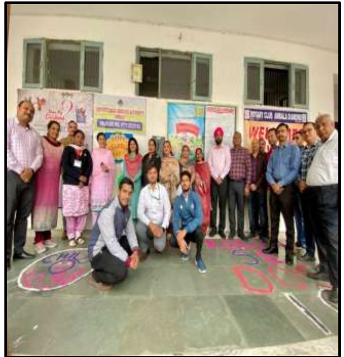
On 14 th November, 2022 , CHILDLINE AMBALA celebrated CHILDLINE Se DOSTI Week Campaign on Children's Day with the Children of Observation Home, Ambala.