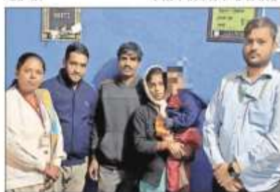
परिवर्तनों को बच्ची सौंपते चाइल्डलाइन टीम के सदस्य।

अम्बाला शहर, 8 दिसम्बर (कोश): जिला युवा विकास संगठन द्वारा संचालित चाइल्डलाइन की टीम ने दूध पर से लापता हुई करीब अठारह से 3 साल की बच्ची को परिवर्तनों से मिलवाया गया। बच्ची करीब 14 व दस्तावेज तय की किए जाने के बाद बच्ची परिवर्तनों को सौंपी गई।