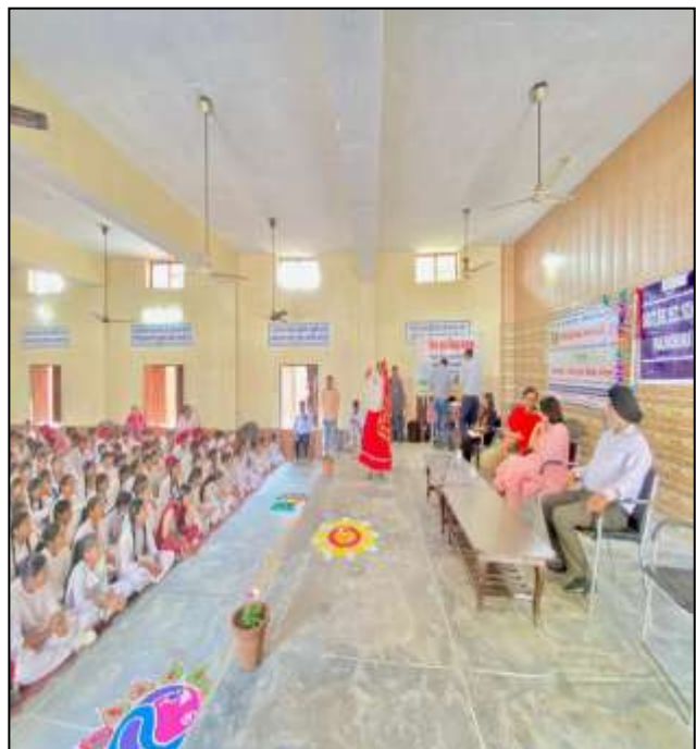
On Dated 22 nd October, 2022 , With Collabroration of District Legal Services Authority, CHILDLINE AMBALA organized a special program at Govt. Senior Secondary Panjokhra, Ambala. Where Rangoli, Diya Making and Painting Competitions were organized in Government Senior Secondary School