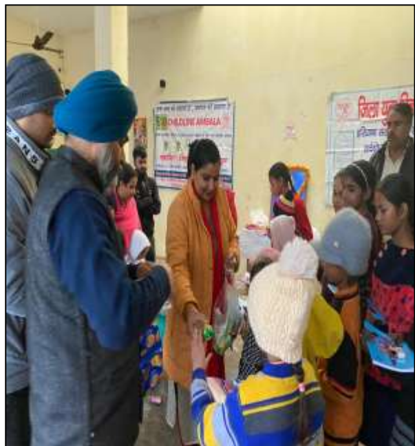
On Dated 12 th January, 2023 , Zila Yuva Vikas Sanghathan and CHILDLINE Ambala organized " OPEN HOUSE " and celebrated the occasion of " Lohri " at CHILDLINE Office with children on the awareness of " CHILD HELPLINE 1098 " & " Child related issues ".