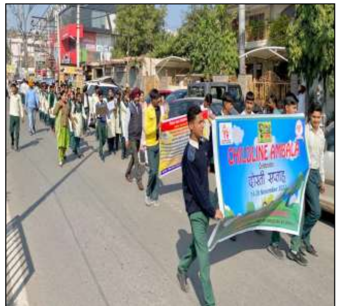
On Dated 16 th November, 2022 , 03rd day of Childline se Dosti Week, CHILDLINE Ambala, organized a "Rally" with the students of Government Senior Secondary School, Prem Nagar, Ambala city on "Child Labour, Child Sexual Abuse, Education and Child Rights .