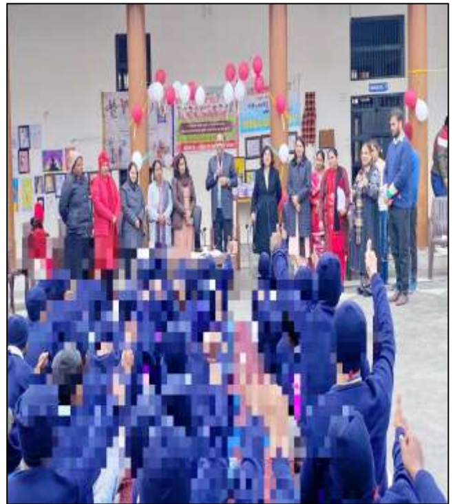
On Dated 30 th December, 2022 , With Collaboration of District Administration and CHILDLINE Ambala organized a special program with the children of Observation Home, Ambala.