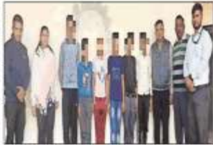
डी.टी.एफ. टीम द्वारा बाल मजदूरी से मुक्त कराया गया बच्चों।

अम्बाला शहर, 5 दिसम्बर (कोश): उद्योग अम्बाला की अर्थशास्त्र में डिप्लोमा टास्क फोर्स टीम द्वारा बाल मजदूरी से संबंधित सभी शिकायतों पर कार्यवाही करते हुए बच्चों को बाल मजदूरी से मुक्त कराया गया। इसके अंतर्गत टीम ने सीएच आर व डब बैचो माल चौक से बच्चों को बाल मजदूरी से मुक्त कराकर बाल कल्याण समिति के समक्ष पेश किया।