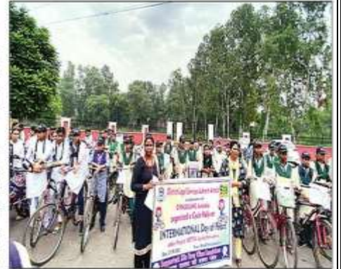
विश्व शांति दिवस के उपलक्ष्य में हर्बल पार्क अंबाला शहर में साइकिल रैली निकालते लोग।