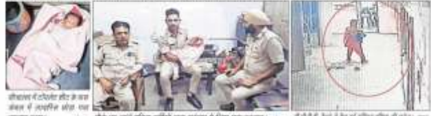
शौचालय में छोड़कर शोध के लिए बस अड्डे में अस्पताल में भेजा गया बच्चा

शोध के लिए गई महिला ने लावारिस शालत में देखा नवजात (तड़का) बच्चा, पुलिस ने मोके पर पहुंच कब्जे में लिया