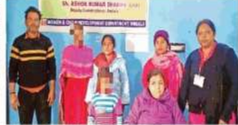
सिटी से रेस्क्यू किया गए दोनों बच्चों को म के सुपुर्दे करते अधिकारी।

जालंधर संरक्षणा, अम्बाला : जिला युवा विकास संगठन संचालित चाइल्ड लाइन 10998 अम्बाला के पास शुक्रवार रात के समय भाई बहन से दो बच्चों को रहकर रेलवे स्टेशन के पास से रेस्क्यू किया गया। दोनों बच्चे राब घन्नाईर जाने वालों सड़क पर मिले थे।