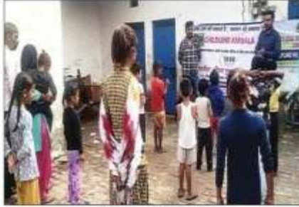
बच्चों को जागरूक करते अधिकारी। संवाद

जिला विधिक सेवा प्राधिकरण से प्रश्नों में लोगों को मुला कानूनी सेवाओं के बारे में बताया। जिला विधिक सेवा प्राधिकरण द्वारा प्रकाशित लीफ़ट सर्विसित