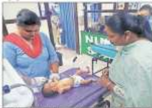
शौचालय में छोड़कर शोध के लिए बस अड्डे में अस्पताल में भेजा गया बच्चा

अम्बाला, 19 अक्टूबर (संवाद)। शोध के अंतर्गत शोध के अड्डे के शौचालय में नवजात को छोड़ कर बस अड्डे में लावारिस शालत में देखा नवजात (तड़का) बच्चा, पुलिस ने मोके पर पहुंच कब्जे में लिया।