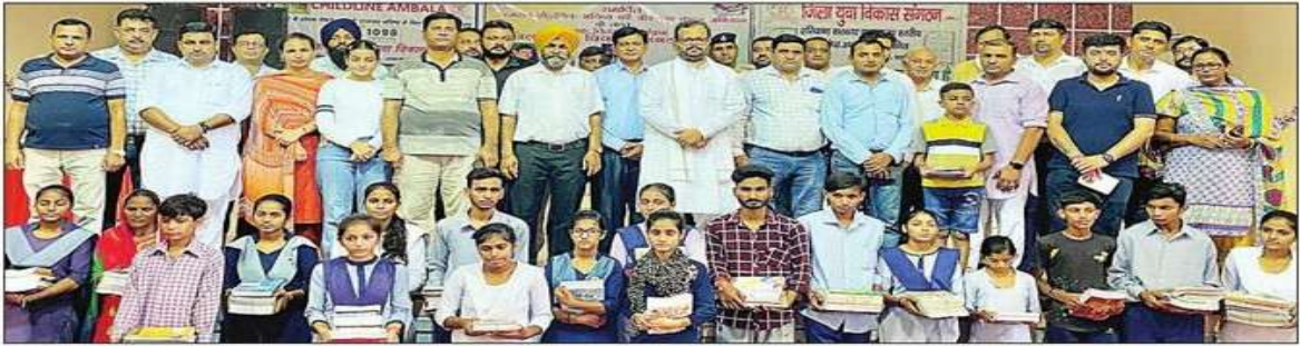
शैक्षणिक सामग्री वितरण के दौरान मौजूद मुख्यातिथि। संवाद