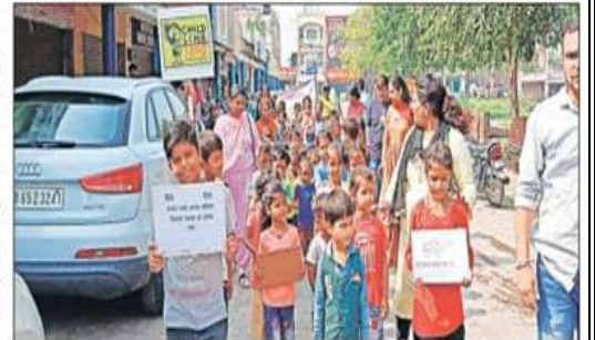
शहर में चाइल्डलाइन टीम के साथ रैली निकालते विभिन्न कॉलोनियों के बच्चे।

अम्बाला शहर, 2 अक्टूबर (कोचर): जिला युवा विकास संगठन द्वारा संचालित चाइल्डलाइन 1098 द्वारा महात्मा गांधी जयंति के उपलक्ष्य में बंद फाटक स्लम एरिया नजदीक अग्रसेन चौक पर रैली कार्यक्रम आयोजित किया गया। चाइल्डलाइन टीम द्वारा बच्चों के साथ