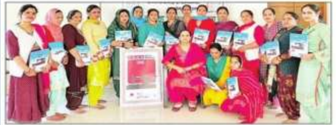
आयोजक प्रशिक्षित महिलाओं को सिलाई किट भेंट करते हुए। संघ