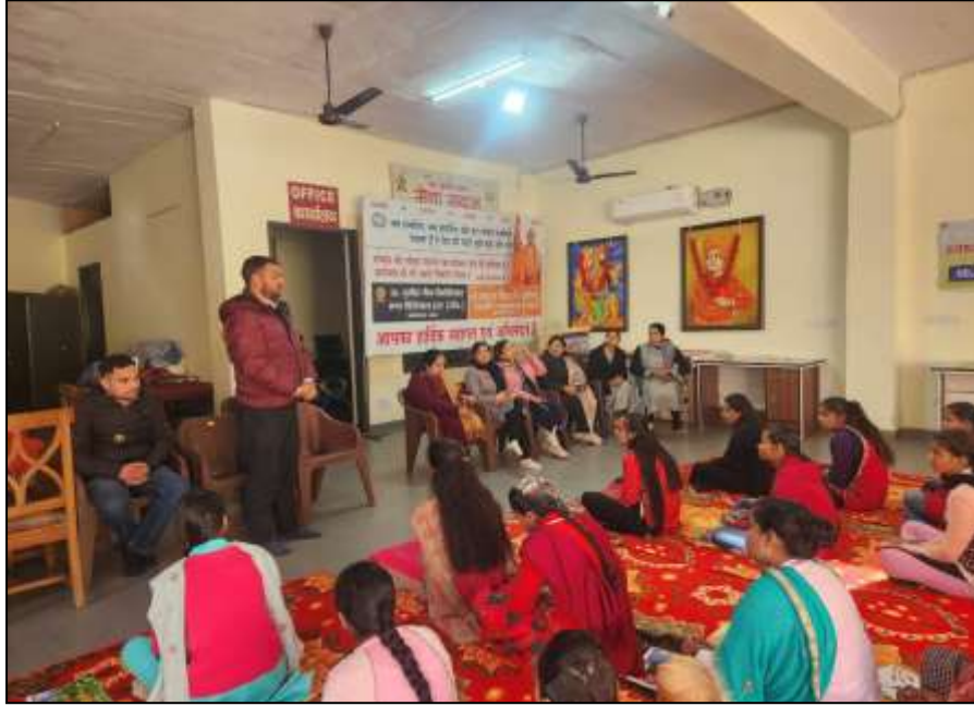
On Dated 03 rd February, 2023 CHIDLIN Ambala organized a special program at Bharat Vikas Parishad, Ghel Road, Ambala where CHIDLIN Ambala Coordinator and Team member aware those children about " CHILD HELPLINE 1098 and Cyber Security ". In which team member aware those students about "CHILD HELPLINE 1098".