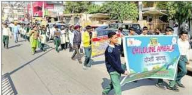
राजकीय वरिष्ठ माध्यमिक विद्यालय प्रेम नगर अंबाला शहर में छात्र रैली निकालते। संवाद